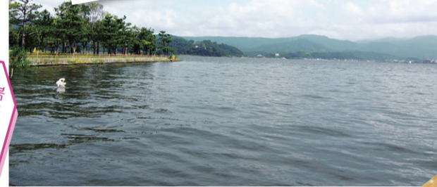
아름다운 린카이 공원의 경치는 드라마 속 장면을 떠올리게 합니다.

일본의 아름다운 호수 위에 떠있는 료칸 보코로! 이 투어는 드라마 속 장면을 떠올리게 합니다.